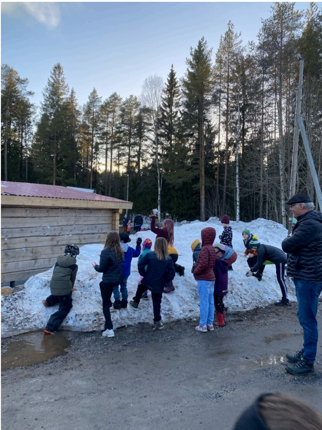
Invigning av vindskyddet på Valborg